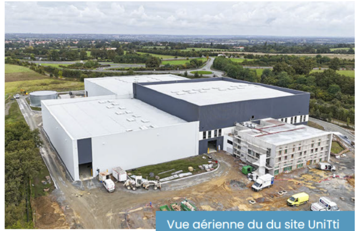
Vue aérienne du site UniTri