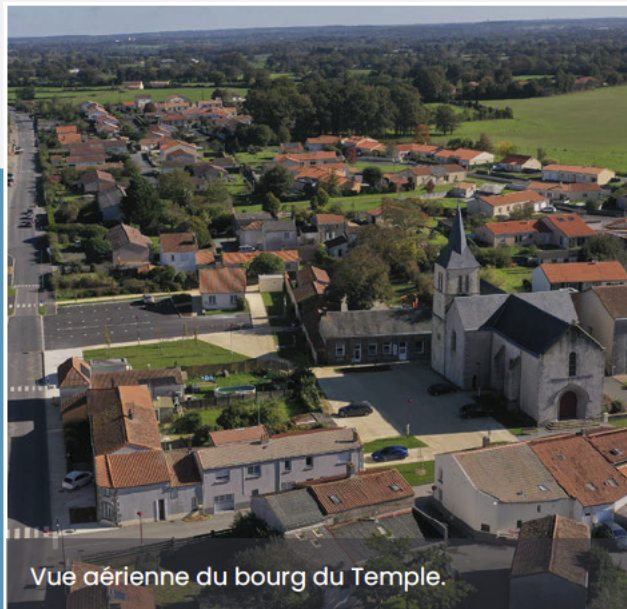
Vue aérienne du bourg du Temple.