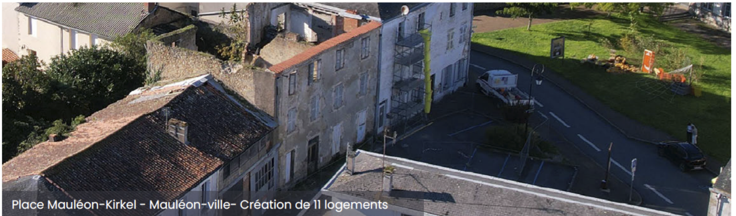
Place Mauléon-Kirkel – Mauléon-ville- Création de 11 logements