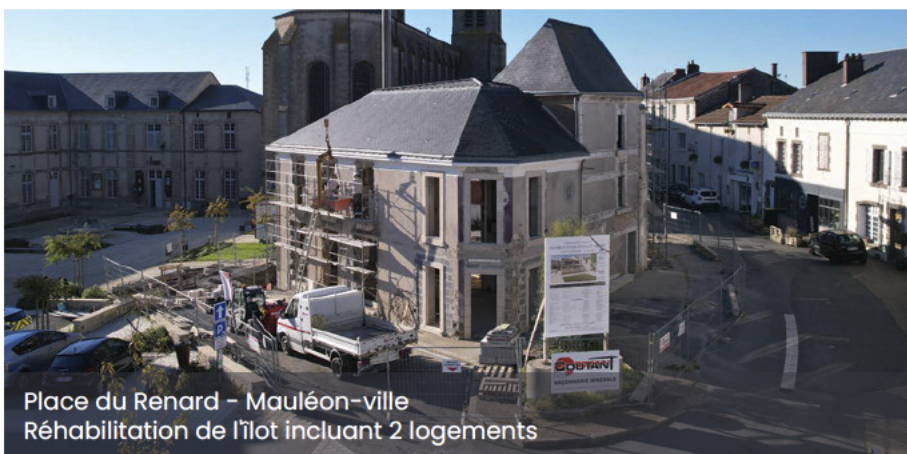
Place du Renard – Mauléon-ville Réhabilitation de l'îlot incluant 2 logements