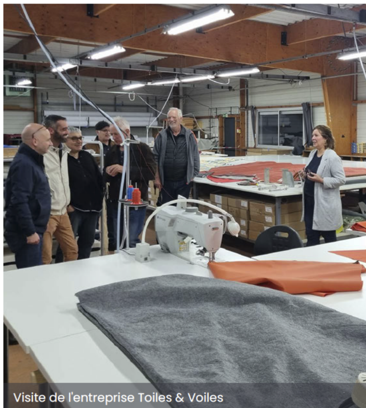
Visite de l'entreprise Toiles & Voiles