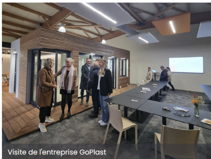
Visite de l'entreprise GoPlast