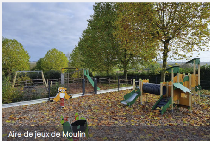
Aire de jeux de Moulins

Enfin, il a noté que la collectivité a également revu complètement l'aire de jeux de Moulins afin de proposer aux enfants du bourg de nouvelles structures répondant à toutes les normes en vigueur.