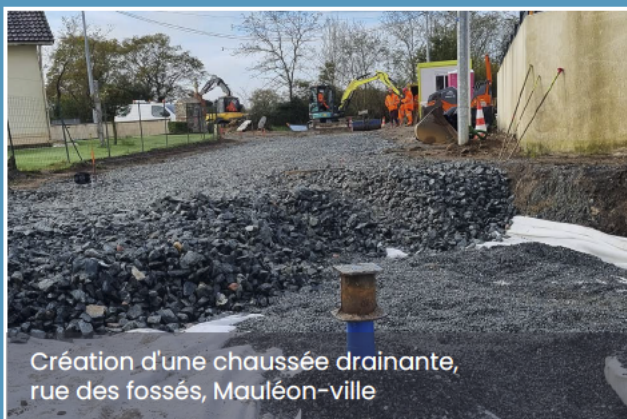
Création d'une chaussée drainante, rue des fossés, Mauléon-ville

A ce titre, la collectivité vient d'achever les travaux de la traversée du bourg du Temple qui ont permis de requalifier la place de la mairie et la place Saint-Sauveur en créant de nombreux espaces végétalisés.