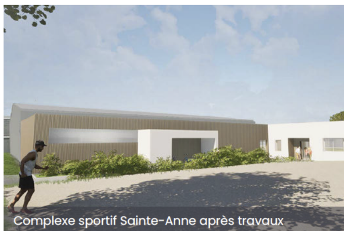
Complexe sportif Sainte-Anne après travaux

Le chantier devrait démarrer d'ici le mois de février et s'achever à la fin de l'année.