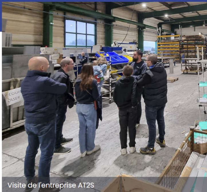
Visite de l'entreprise AT2S

Rendez-vous en 2025, pour les rencontres économiques du Temple et de Mauléon-ville