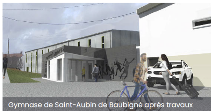
Gymnase de Saint-Aubin de Baubigné après travaux