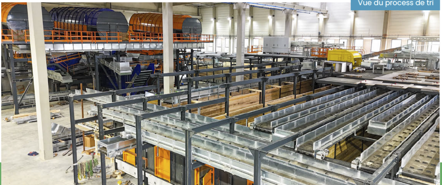
Vue du process de tri

D'ici la fin de l'année 2025, les scolaires pourront découvrir ce bel équipement.