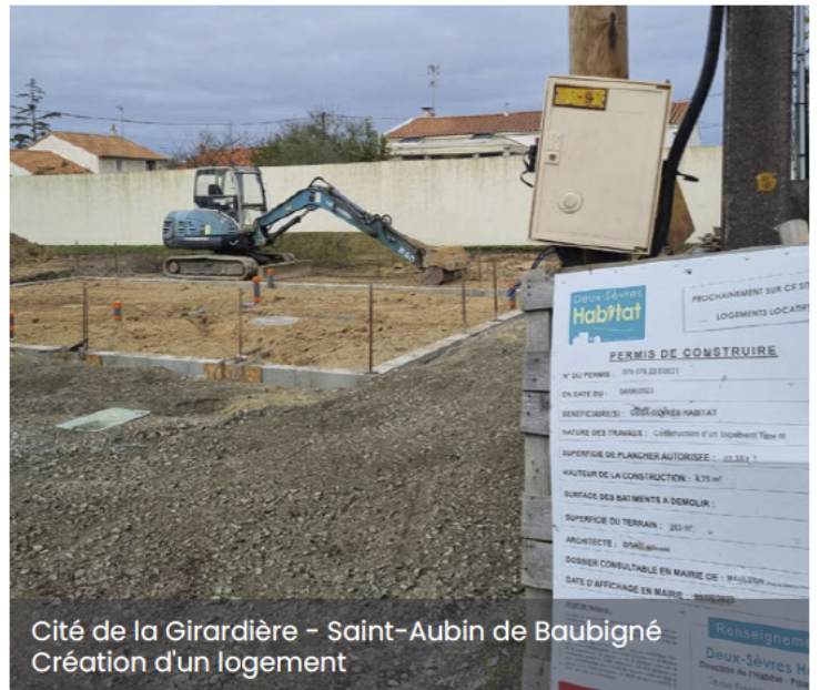
Cité de la Girardière – Saint-Aubin de Baubigné Création d'un logement