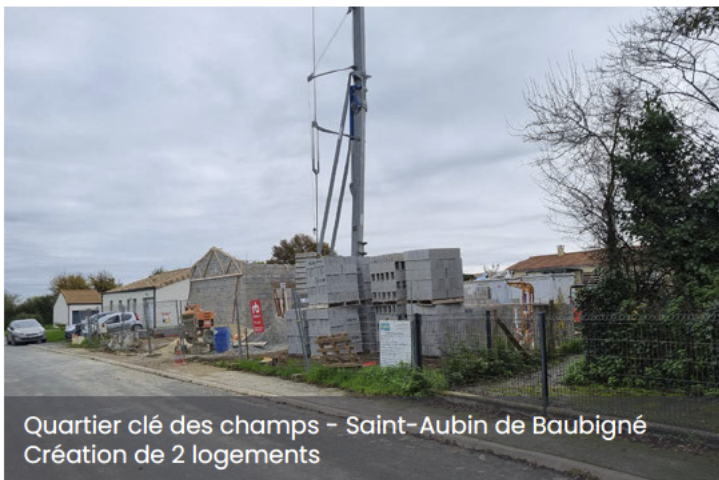
Quartier clé des champs – Saint-Aubin de Baubigné Création de 2 logements