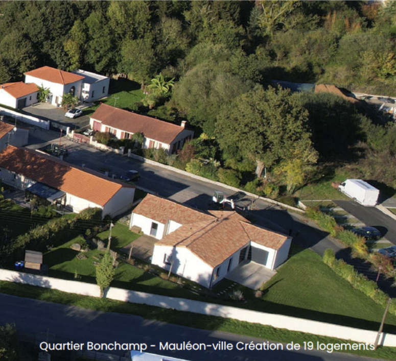
Quartier Bonchamp – Mauléon-ville Création de 19 logements