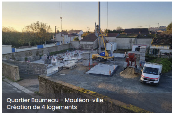
Quartier Bourneau – Mauléon-ville Création de 4 logements