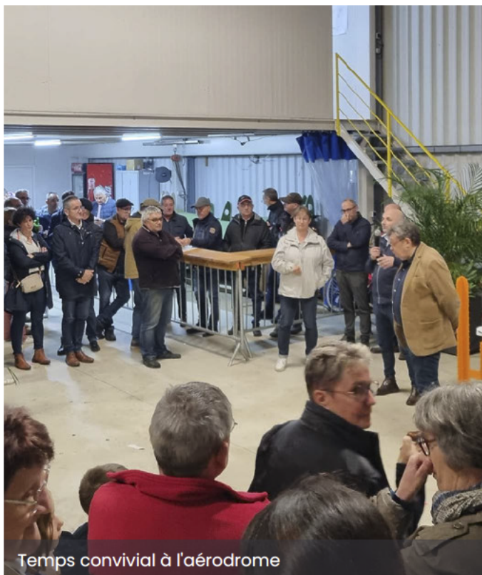
Temps convivial à l'aérodrome