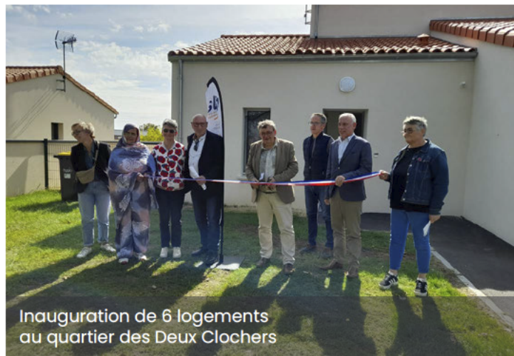
Inauguration de 6 logements au quartier des Deux Clochers

À Saint-Aubin de Baubigné, Deux Sèvres Habitat construit également 3 logements locatifs qui seront livrés d'ici septembre 2025.