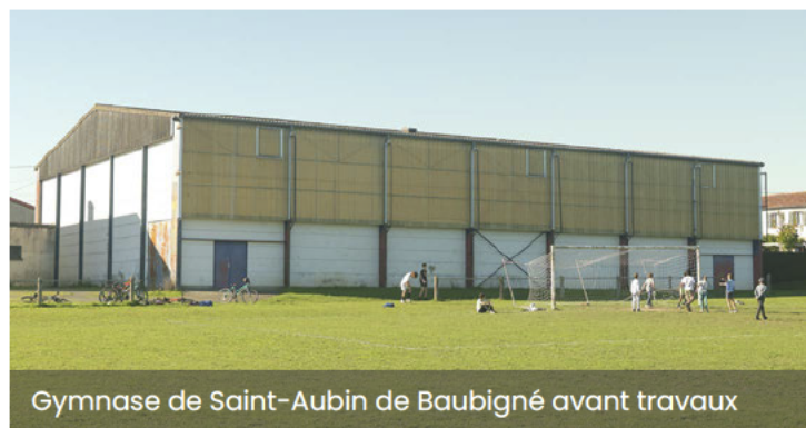
Gymnase de Saint-Aubin de Baubigné avant travaux

La volonté de la commune est de tendre vers un bâtiment ayant le plus faible impact carbone possible et à la gestion la moins coûteuse, tant en terme énergétique que d'entretien. Elle a confié la réalisation des travaux au cabinet d'architecture FRENESIS (85420 MAILLEZAIS). Ces derniers devraient débuter d'ici le mois de juin prochain pour une durée de 12 mois.