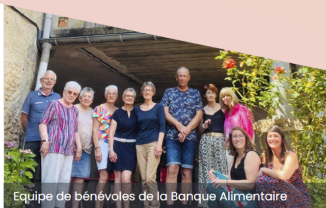
Equipe de bénévoles de la Banque Alimentaire

(veille sociale, actions en faveur des habitants, prévenir les situations d'isolement, partenariat avec les acteurs de la santé, aider à compléter les dossiers de santé...)