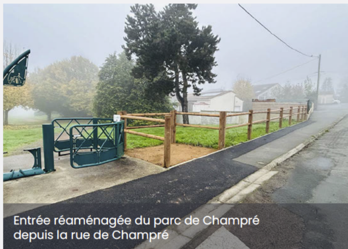
Entrée réaménagée du parc de Champré depuis la rue de Champré

Cette aire de jeux deviendra ainsi un espace de rencontre où la diversité est encouragée par le jeu.