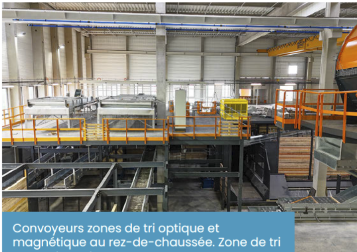
Convoyeurs zones de tri optique et magnétique au rez-de-chaussée. Zone de tri manuel au-dessus

Le bardage, qui assure l'isolation et la protection des bâtiments, est désormais totalement installé. De plus, toutes les portes ont été posées, permettant de mettre à l'abri les matériaux entrants et sortants.