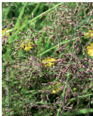
Agrion de Mercure